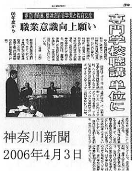
神奈川新聞 2006年4月3日