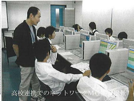
高校連携でのネットワークMG大会開催